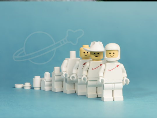
Monique pour cahierjosephine.canalblog.com